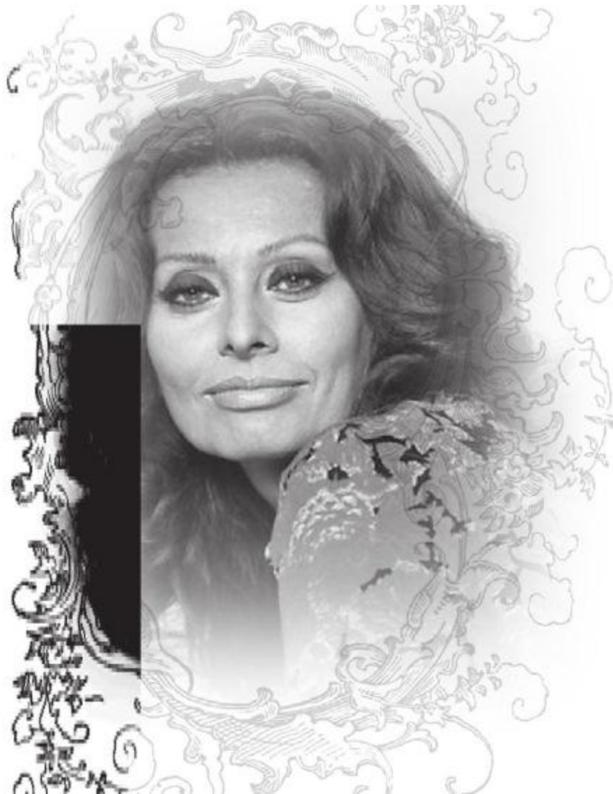
Софи Лорен. 1978 год.

Хороший сценарий попался на глаза только в 1994 году. Хороший сценарий, хороший режиссёр и хороший продюсер. И всё это – Роберт Олтмэн, предложивший Софи сыграть в роскошном фильме «Прет-а-порте» (известном у нас под названием «Высокая мода»). Причём сыграть вместе с Марчелло Мастоияни, с которым, как оказалось, Софи не работала уже... 16 лет – с фильма «Кровная месть», выпущенного на экраны в 1978 году.