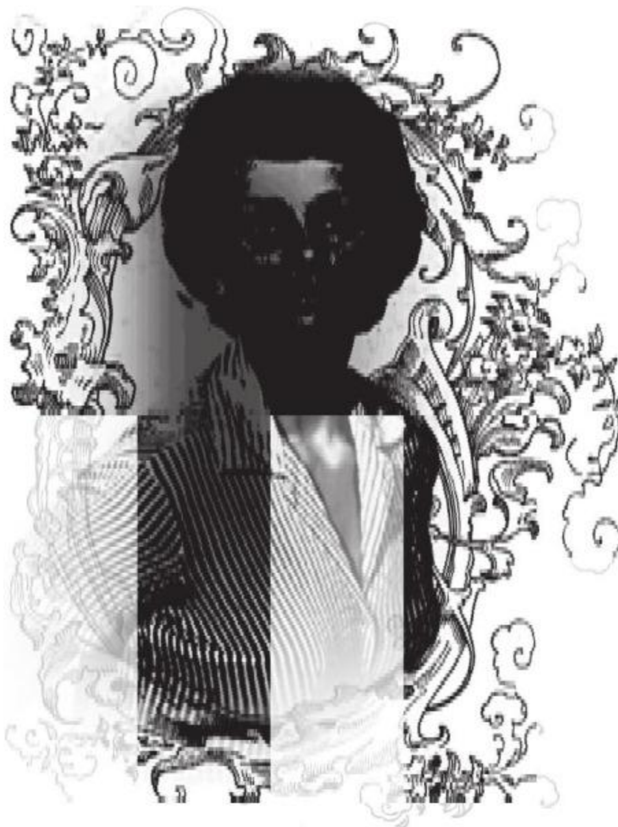
Софи Лорен в 1958