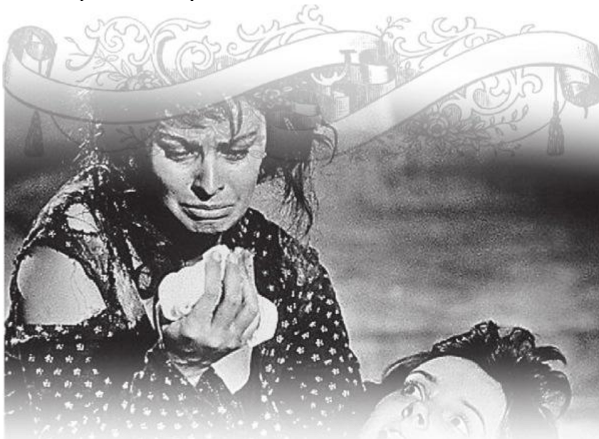
Софи Лорен в фильме «Чочара» («Две женщины»).

Этот антифашистский фильм является одним из лучших творений Витторио Де Сика. И высочайшим актёрским достижением Софи Лорен. Его невозможно смотреть без дрожи, без слёз, без сердечного волнения. Именно тот случай, когда проявляется магия кинематографа – написанная писателем и сыгранная актёрами человеческая судьба становится реальной самой реальности.