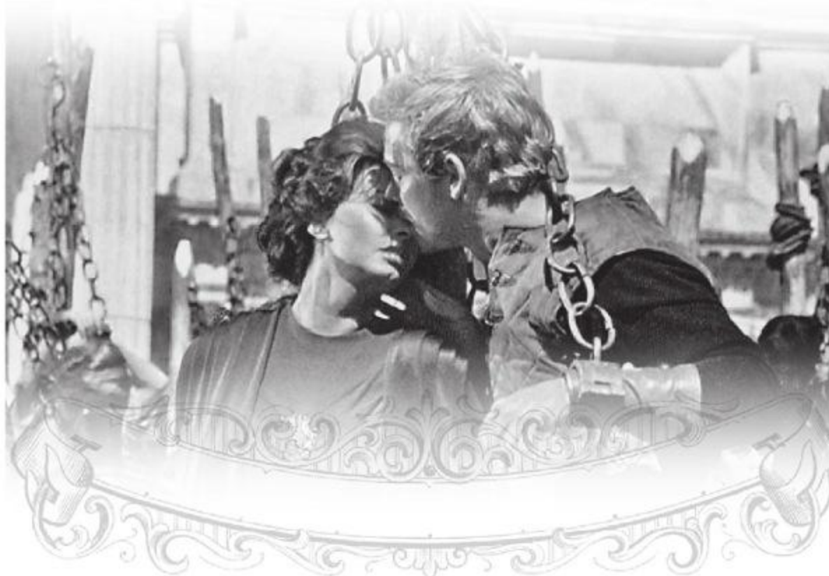
Софи Лорен в роли Луциллы в фильме «Падение Римской империи». 1964 год.

Провал картины Энтони Мэнна поставил точку на самом жанре пеплума. А что же тогда фильм «Гладиатор» 2000 года? Попытка возрождения эпического жанра, того самого, забытого кинематографистами пеплума. И попытка, следует признать, очень удачная (вспомним хотя бы «Трою», «Страсти Христовы» и «300 спартанцев»). В наше время снимать картины в жанре пеплума стало проще благодаря возможностям компьютерной обработки и дорисовки экранного изображения.