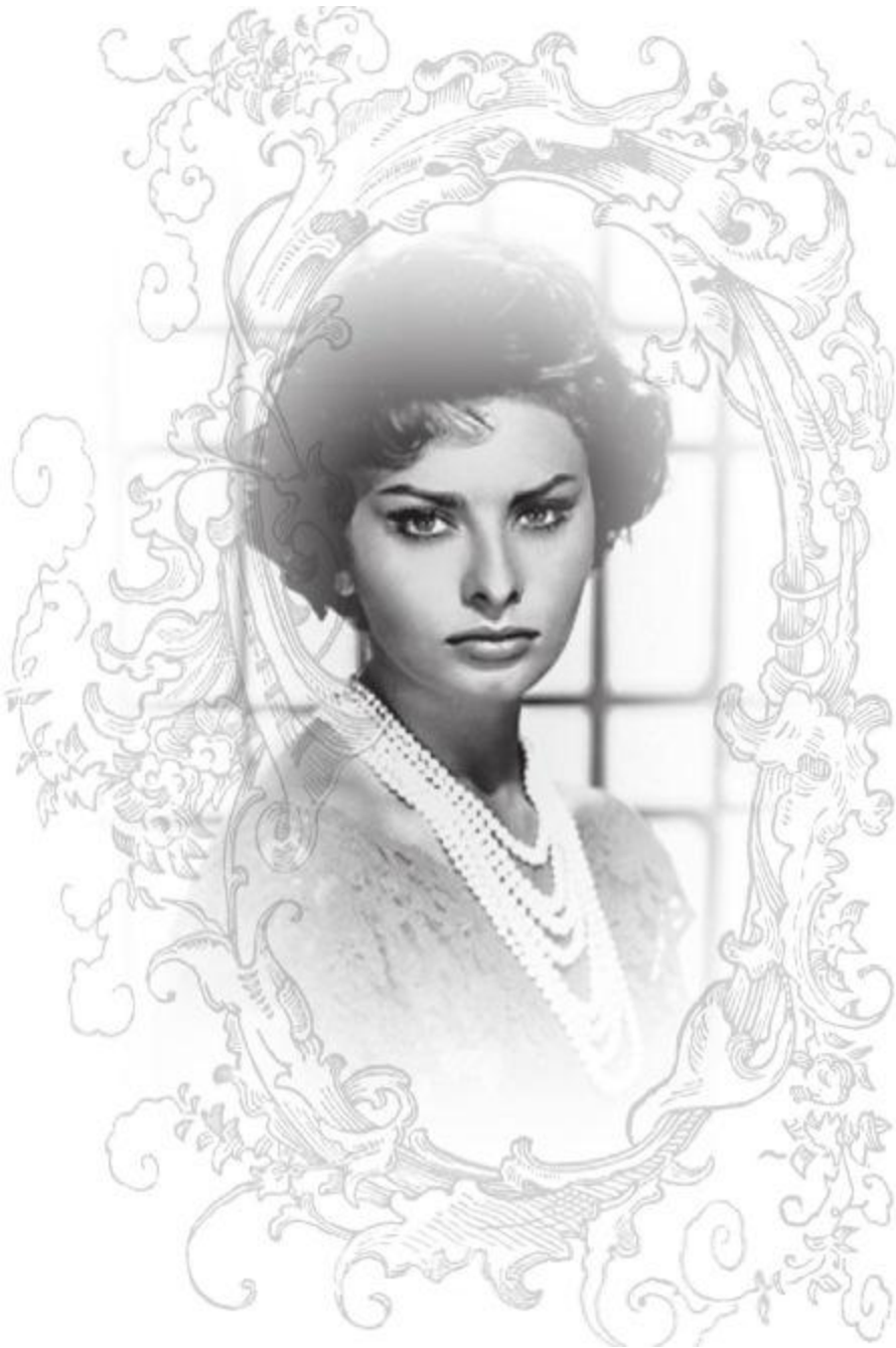
Софи Лорен. Лос-