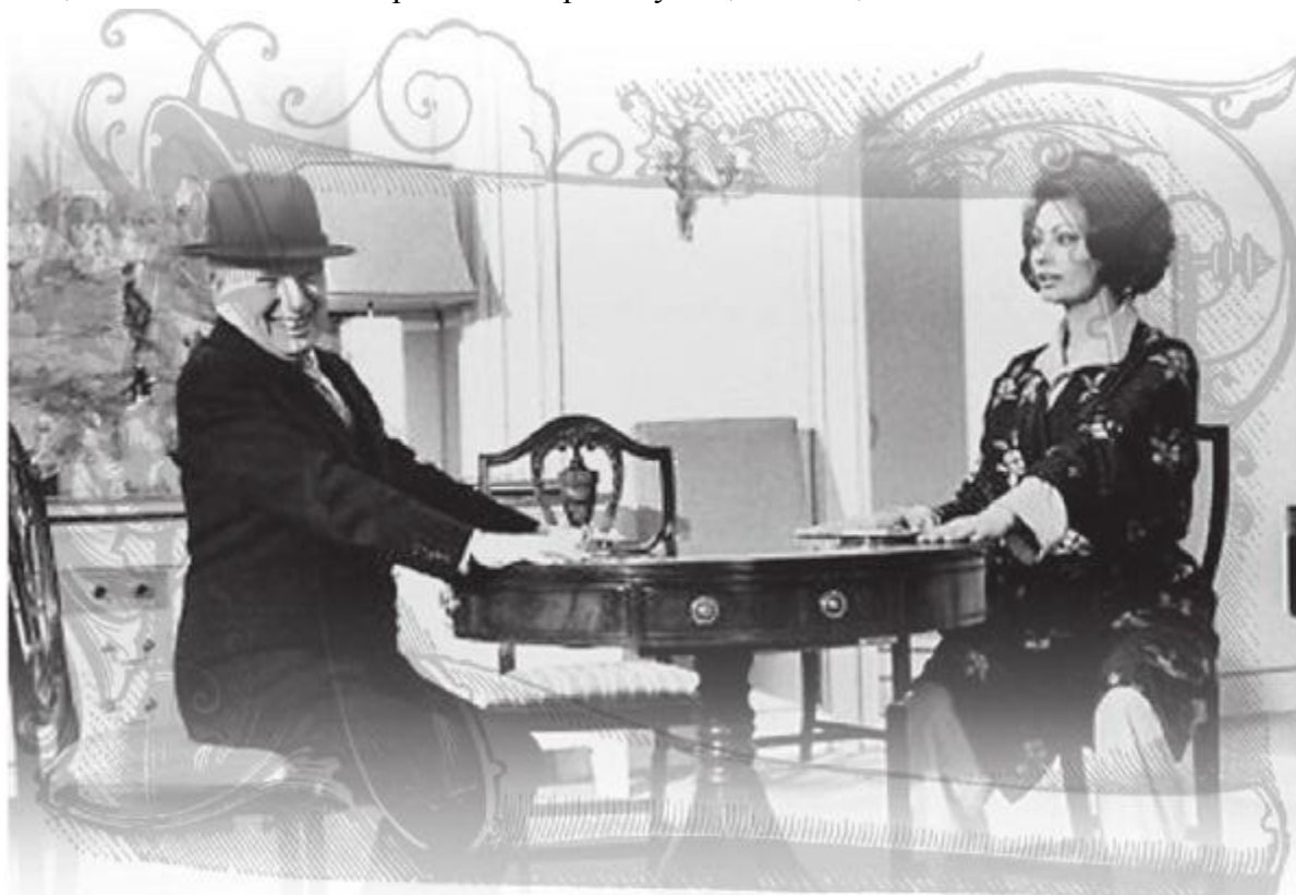
Софи Лорен и Чарли Чаплин.

Десятки славных имён... А что говорит о них Софи? Только хорошее. Она их любит – всех, с кем ей доводилось работать. Врагов у неё, похоже, нет.