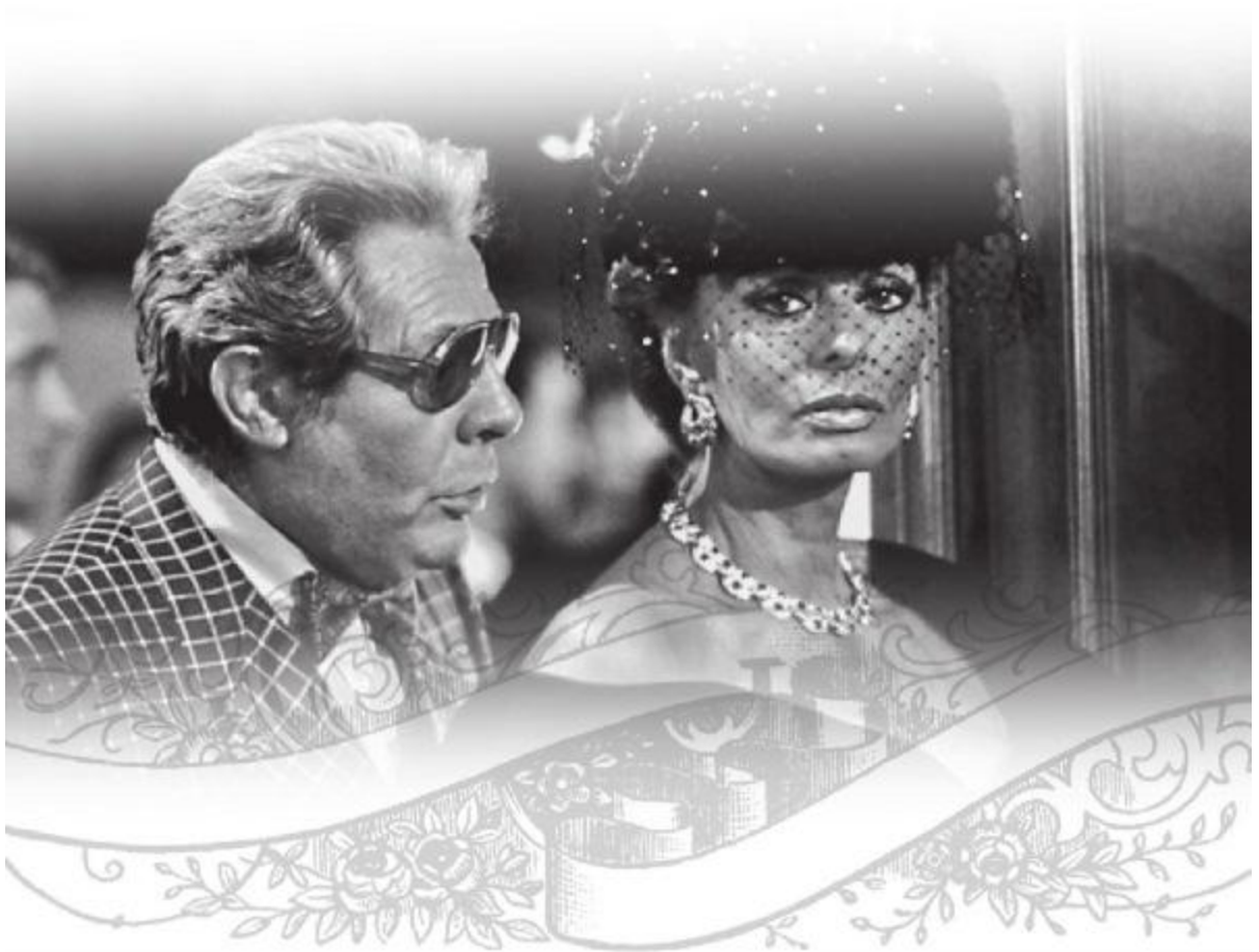
И снова Лорен и Мastroяни в фильме «Прет-а-порте». 1994 год.