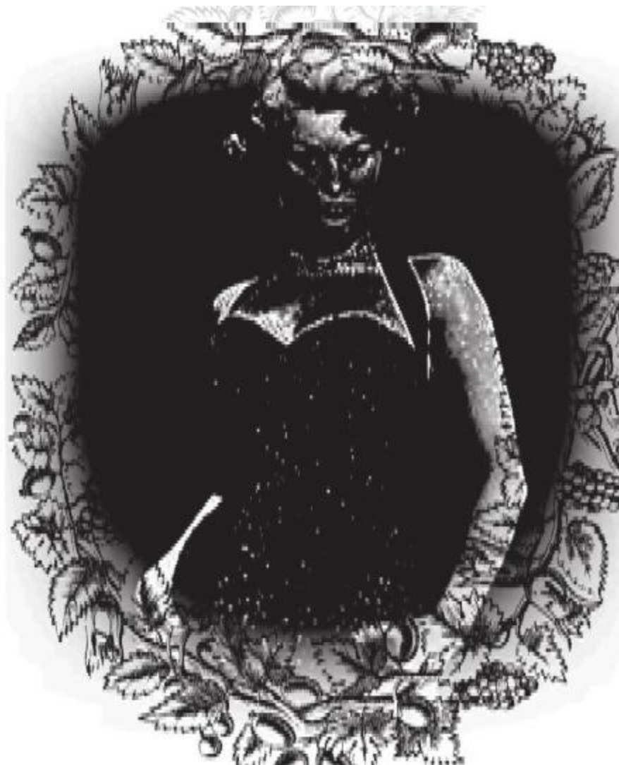
Софи в фильме