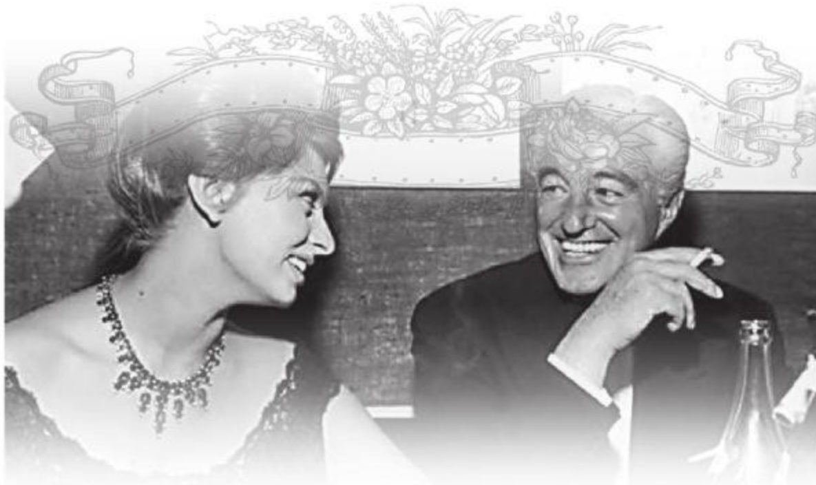
Софи Лорен и Витторио Де Сика на пресс-конференции, посвящённой фильму «Чочара». Милан. 1960 год.

А что Карло Понти? Он этой привязанностью жены... гордился.