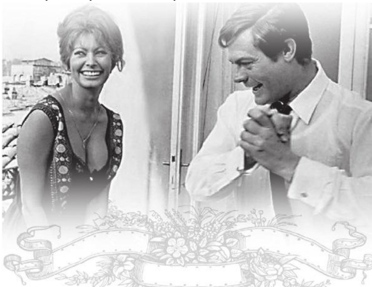
Лорен и Мastroянни в фильме Too Bad She's Bad.