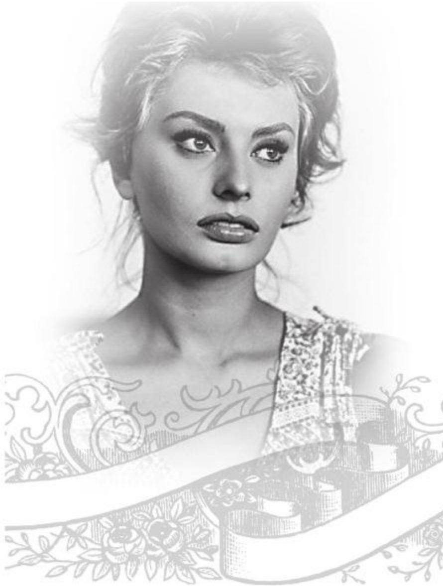
Софи Лорен дома.