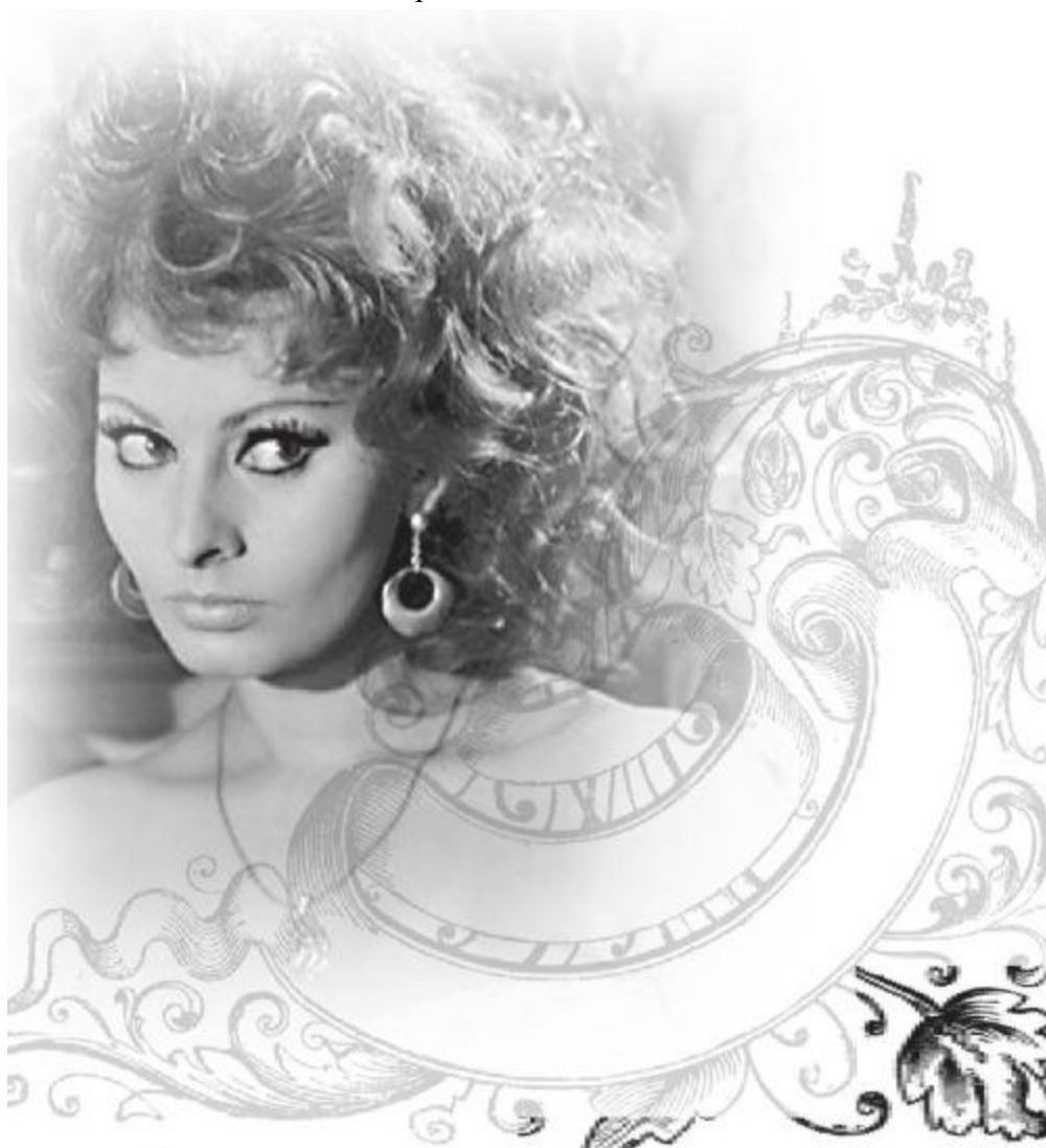
Софи Лорен в фильме «Брак по-итальянски». 1964 год.

А время для семейства Лорен-Понти было непростым. Софи стремительно теряла популярность, а с ней и баснословные гонорары. На кинематографический Олимп Италии пробивались другие, более молодые актрисы. Софи чувствовала себя неуверенно. От отчаяния спасла, как всегда, работа.