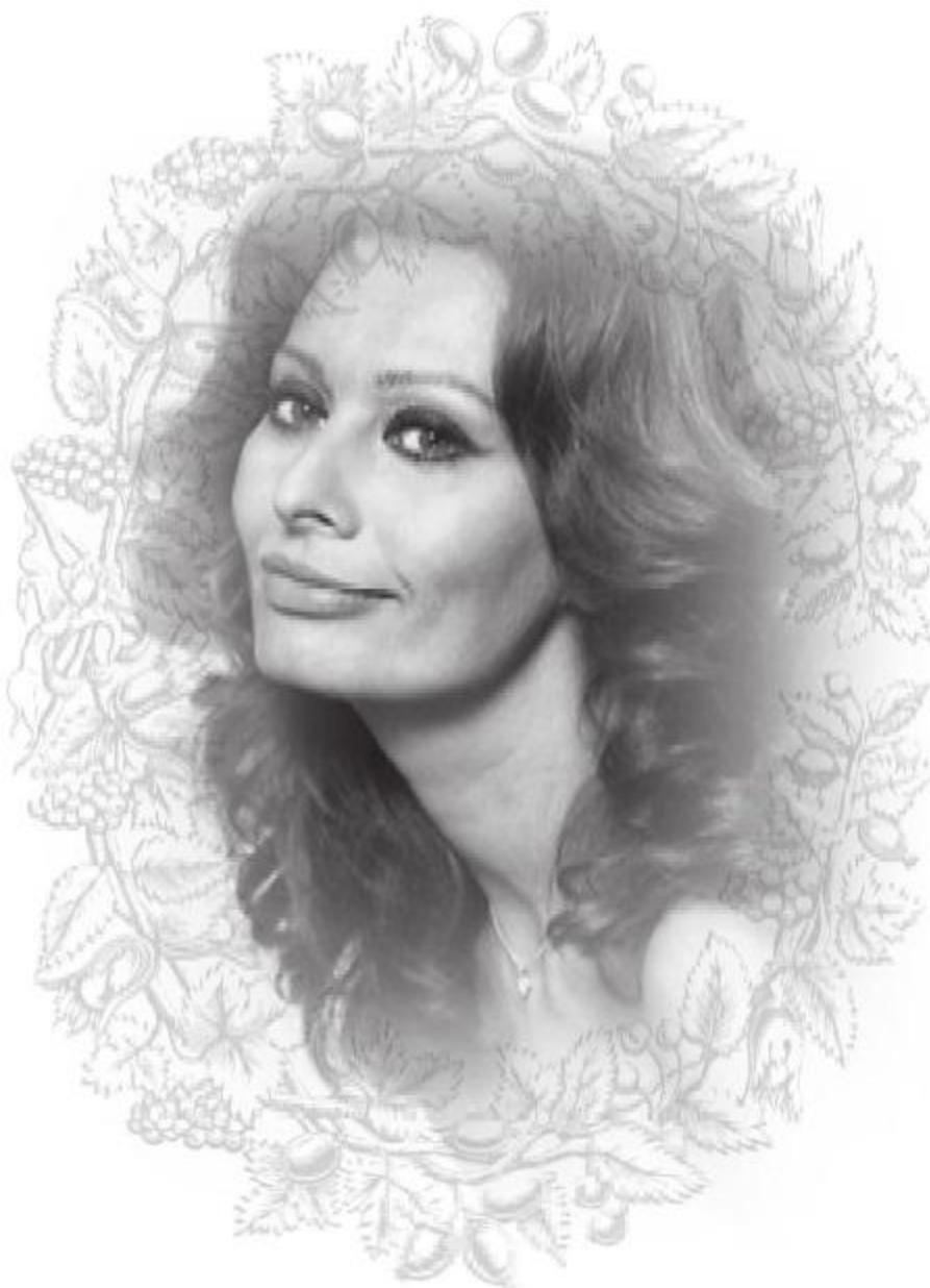
Софи Лорен. 1978 год.