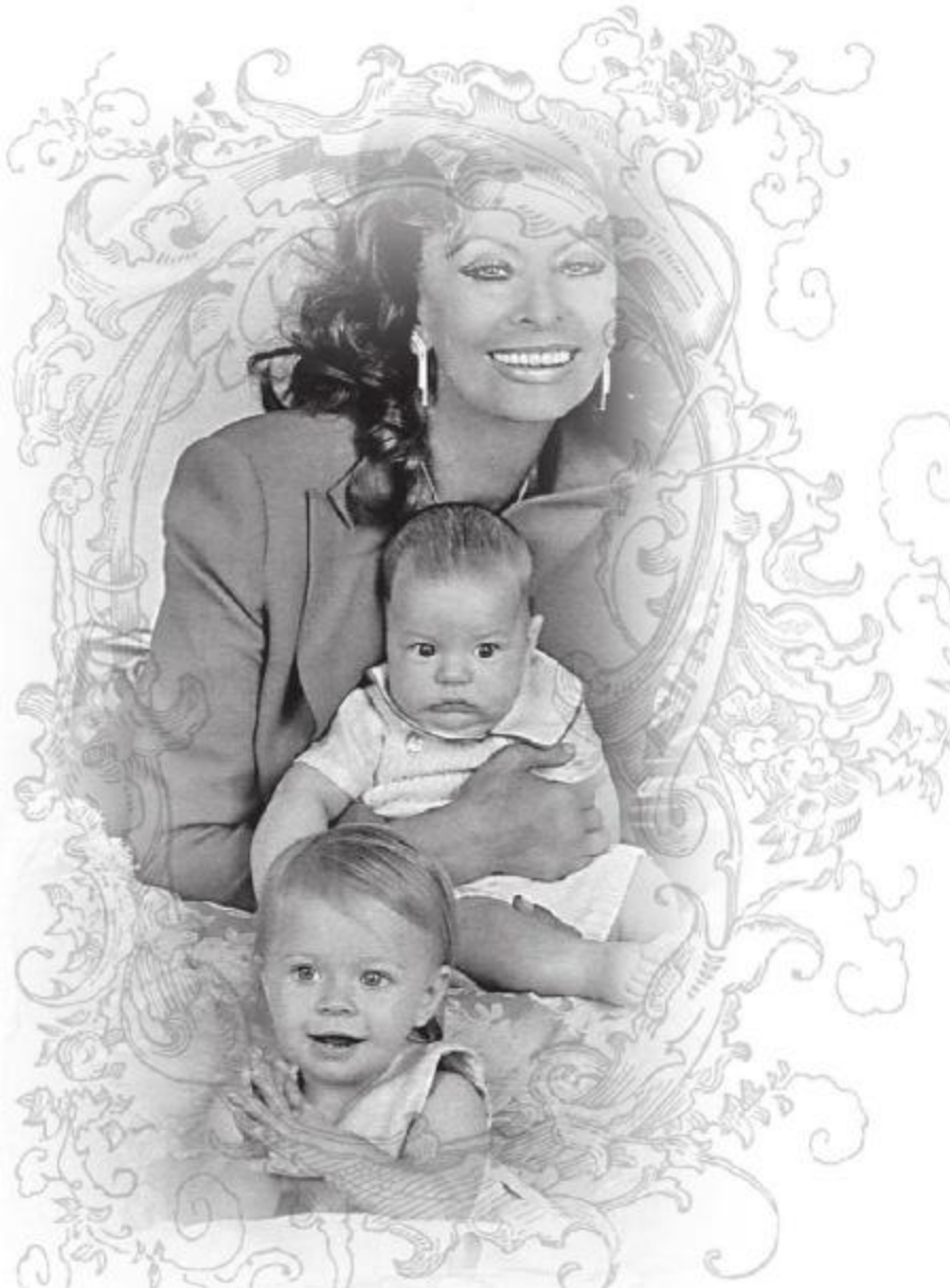
Софи с внуками.