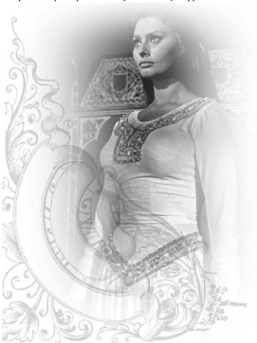
Сид». 1961 год.

Зритель, конечно, повалил валом на историческую драму, поскольку этот жанр был в те годы необычайно популярен. Но помимо развлекательного и познавательного моментов важно и эстетическое удовольствие – видеть на экране сказочно красивую женщину, имя которой – Софи Лорен – знали уже по всему миру.