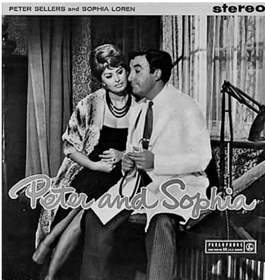
Обложка очень популярной пластинки: Софи Лорен поёт с Питером Селлерсом.

Ну и уж точно – слушая голос Софи, можно говорить о её музыкальном даре. Здесь есть сам предмет обсуждения и пристального внимания – не только почитателей её таланта, но и специалистов в области музыки... О многих ли эстрадных звёздах можно сказать то же самое?