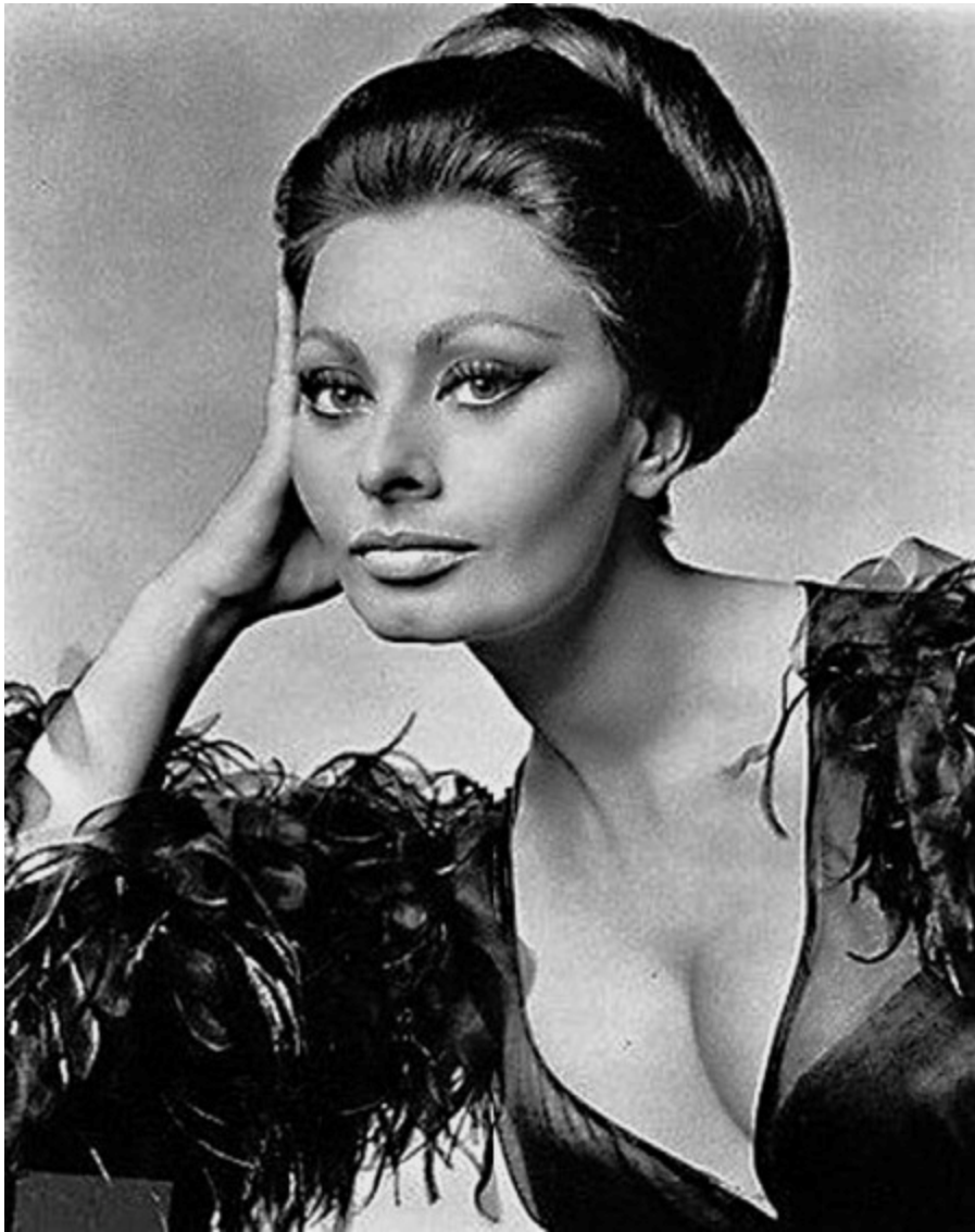
Софи Лорен в 1966