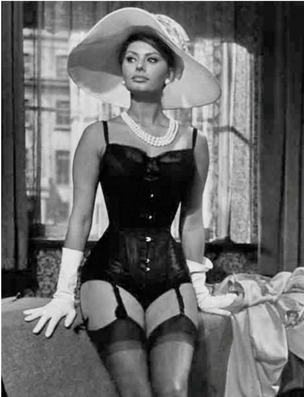
Софи Лорен в