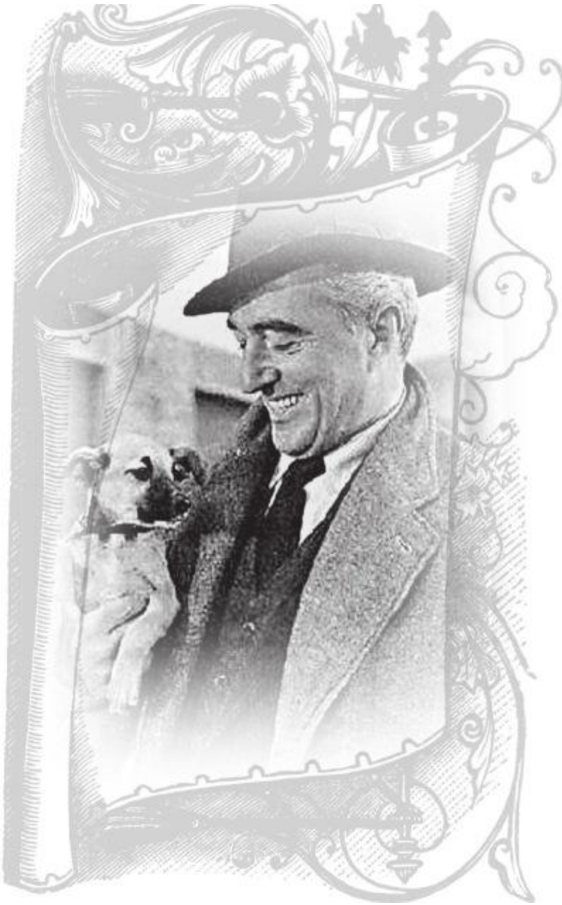
Витторио Де Сика.

Софи влюблялась во многих режиссёров и актёров, с которыми ей доводилось работать. Чувство к Де Сике было иного порядка, нежели влюблённость молодой женщины (а ей исполнилось всего 20 лет!) в «старика», перешагнувшего уже 50-летний рубеж. Нет, она преклонялась перед талантом великого режиссёра. Она ловила каждое его слово. И последующие двадцать лет творческой жизни Лорен связаны с Витторио. 14 фильмов, которые поставил Де Сика с участием Софи, актриса называла лучшими в своей карьере.