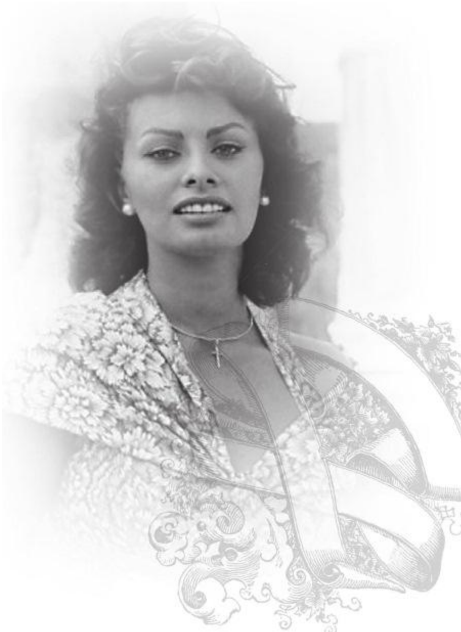
Софи в фильме