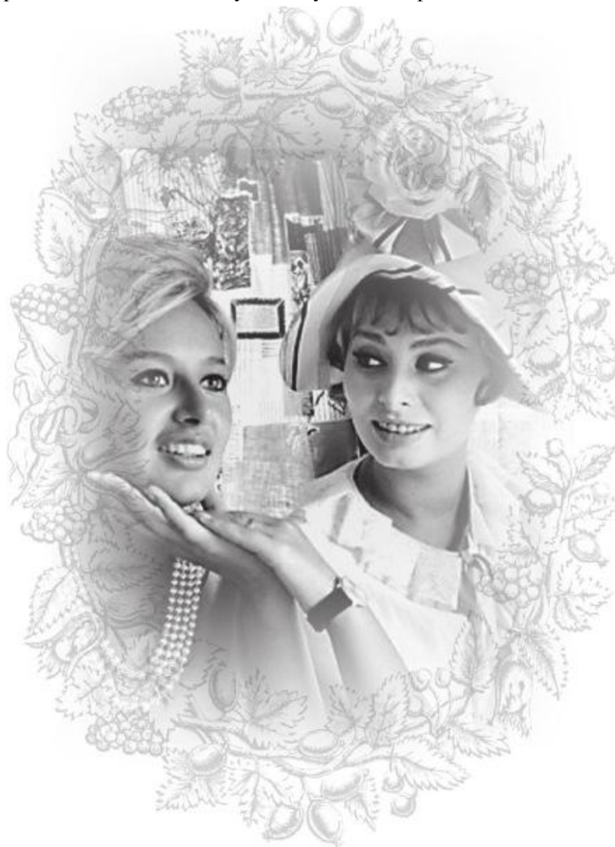
Софи (справа) и её сестра Анна Мария, обе ослепительно красивы, начало 1960-х годов.