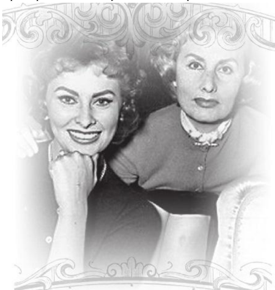
Софи и матушка