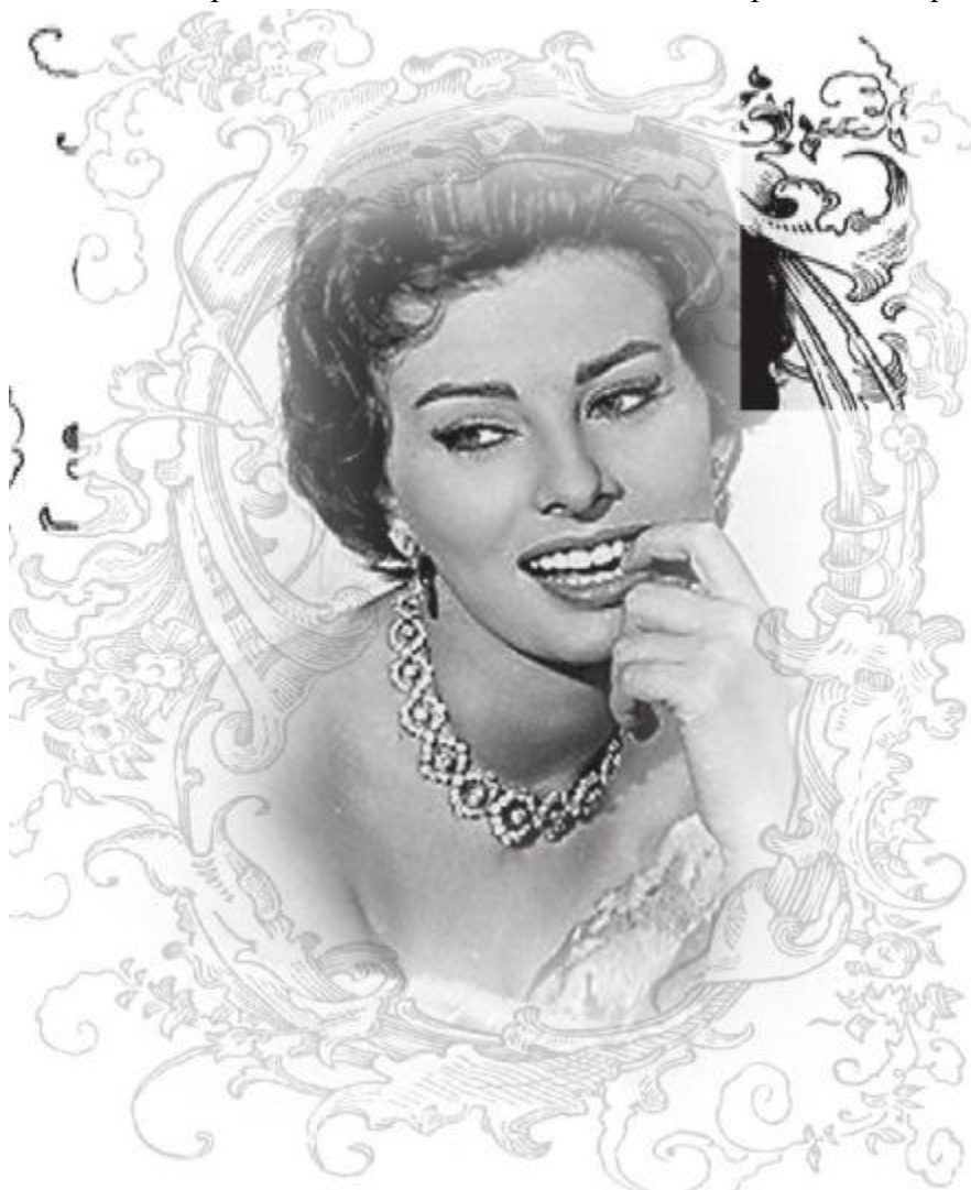
Софи Лорен в 1958

Приехав в Америку, Понти занялся контрактами Лорен. В результате она сыграла в 12 фильмах различных голливудских кинокомпаний. И в Италию вернулась очень богатой женщиной и признанным мастером психологического кино. В её таланте уже никто не сомневался, кроме... Анны Маньяни. Но эта история ещё впереди.