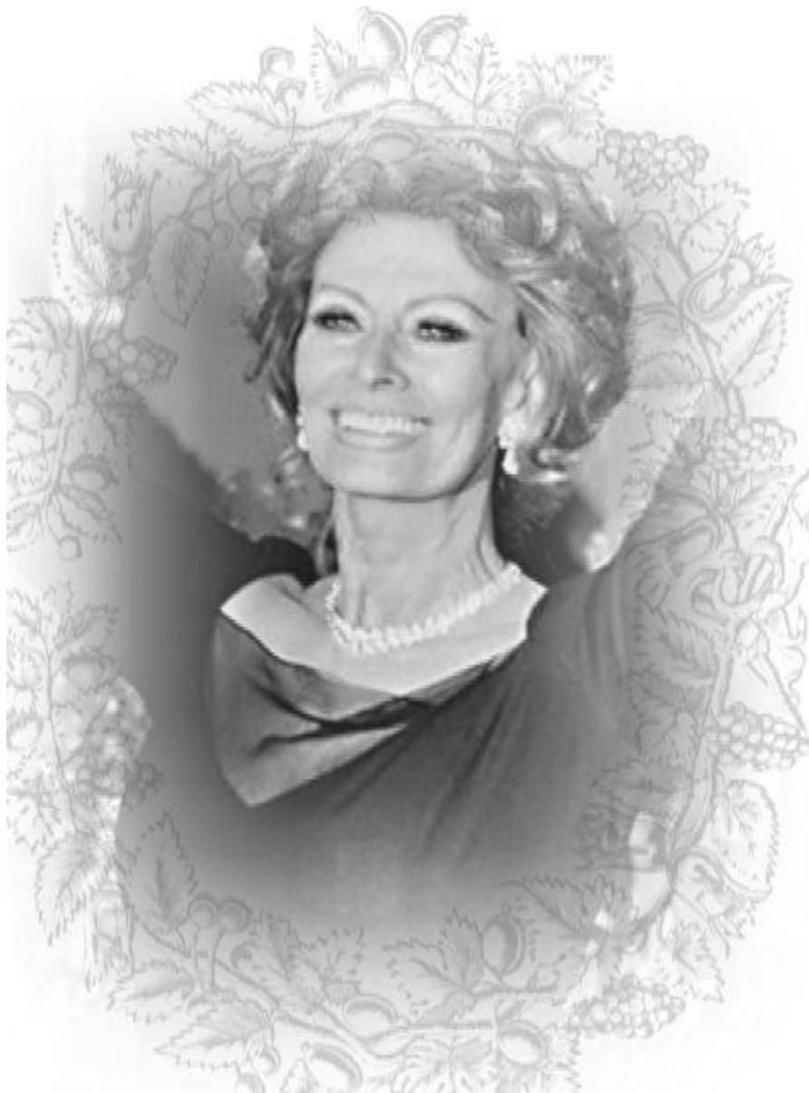
Софи Лорен на ежегодном вручении наград киноакадемии «Оскар». 1999 год.

И репортёры её любят... Софи невозможно не любить. Она – единственная.