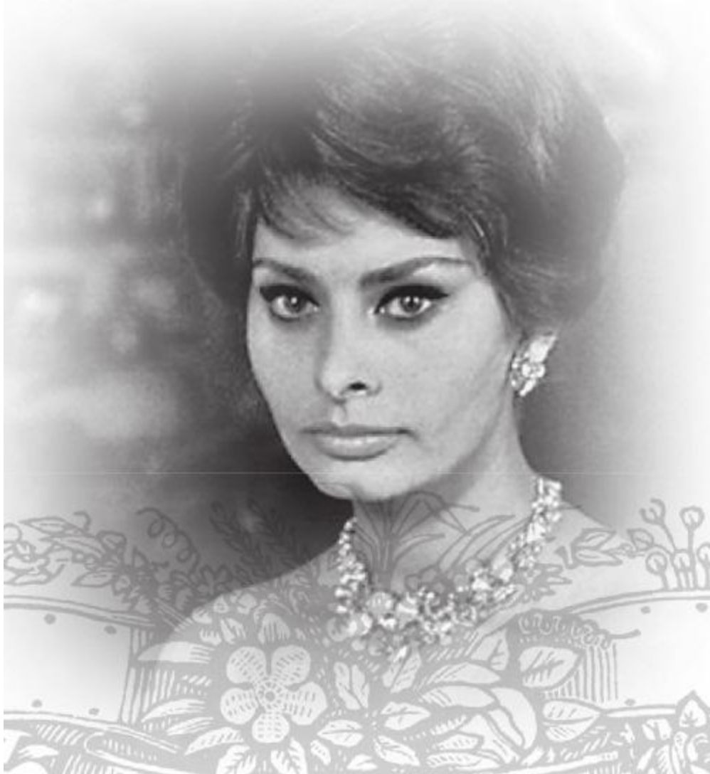
Софи Лорен –

Наряду с уже упомянутыми сплетнями пересуды относительно «измен» Софи ранили сердце Карло. Но он никогда не сомневался в своей супруге. Напротив, он доверял ей, как самому себе, а она – ему. В 1982 году Италия смогла убедиться, что это не просто слова.