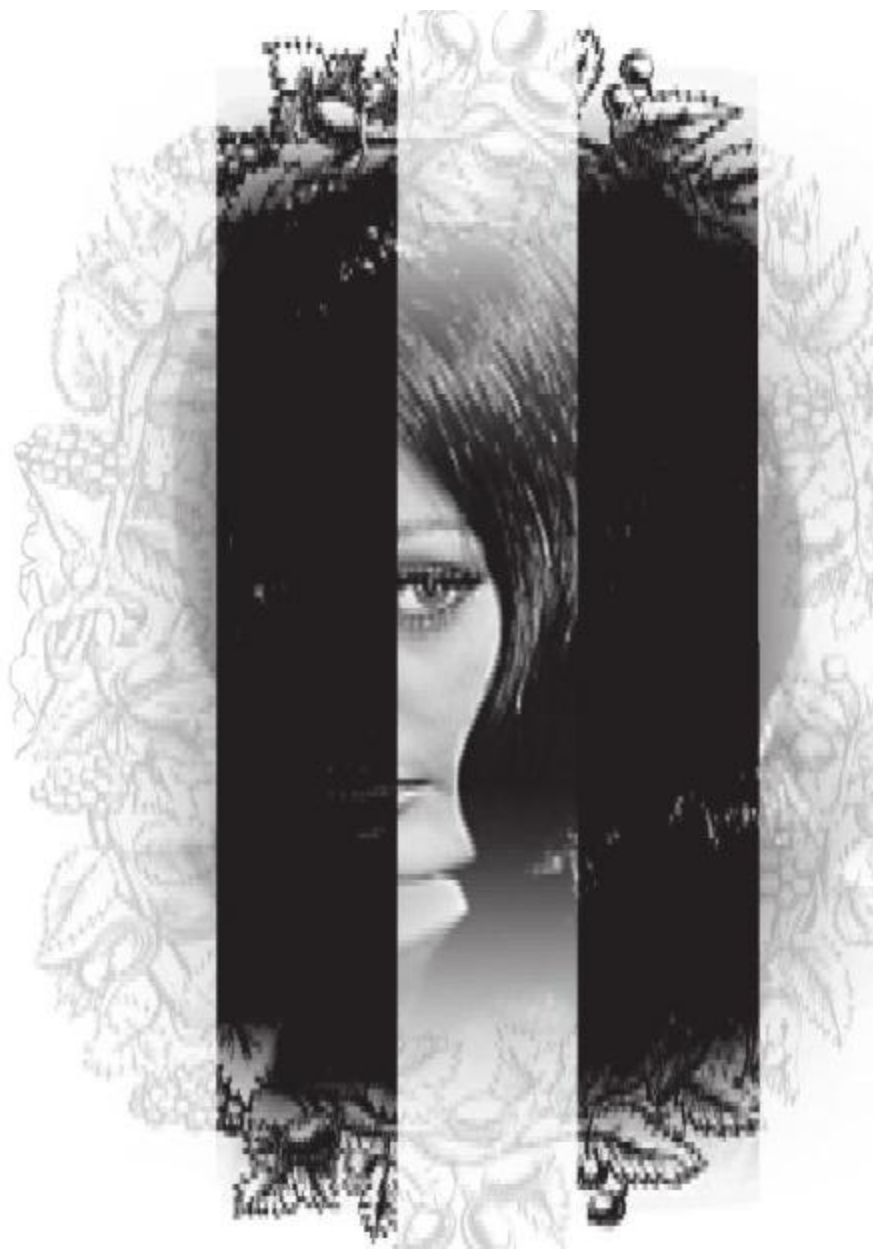
Софи Лорен. 1965 год.