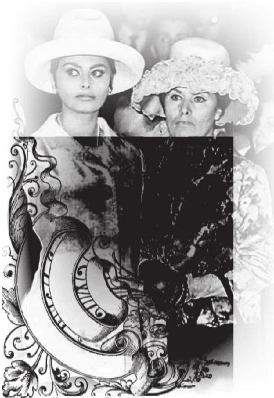
Софи и матушка

Ромилда на свадьбе Романо Муссолини и Анны Марии Шиколоне. 1962 год.