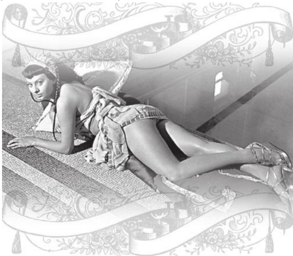
В роли Аиды.

Первая действительно большая роль Софи Лорен – главная роль в фильме «Аида» по опере Дж. Верди. Вторая – роль Клеопатры в фильме «Две ночи с Клеопатрой». Оба фильма сняты в 1953 году. «Клеопатра» вышла чуть раньше и пользовалась зрительским успехом на волне всеобщего успеха «Аиды».