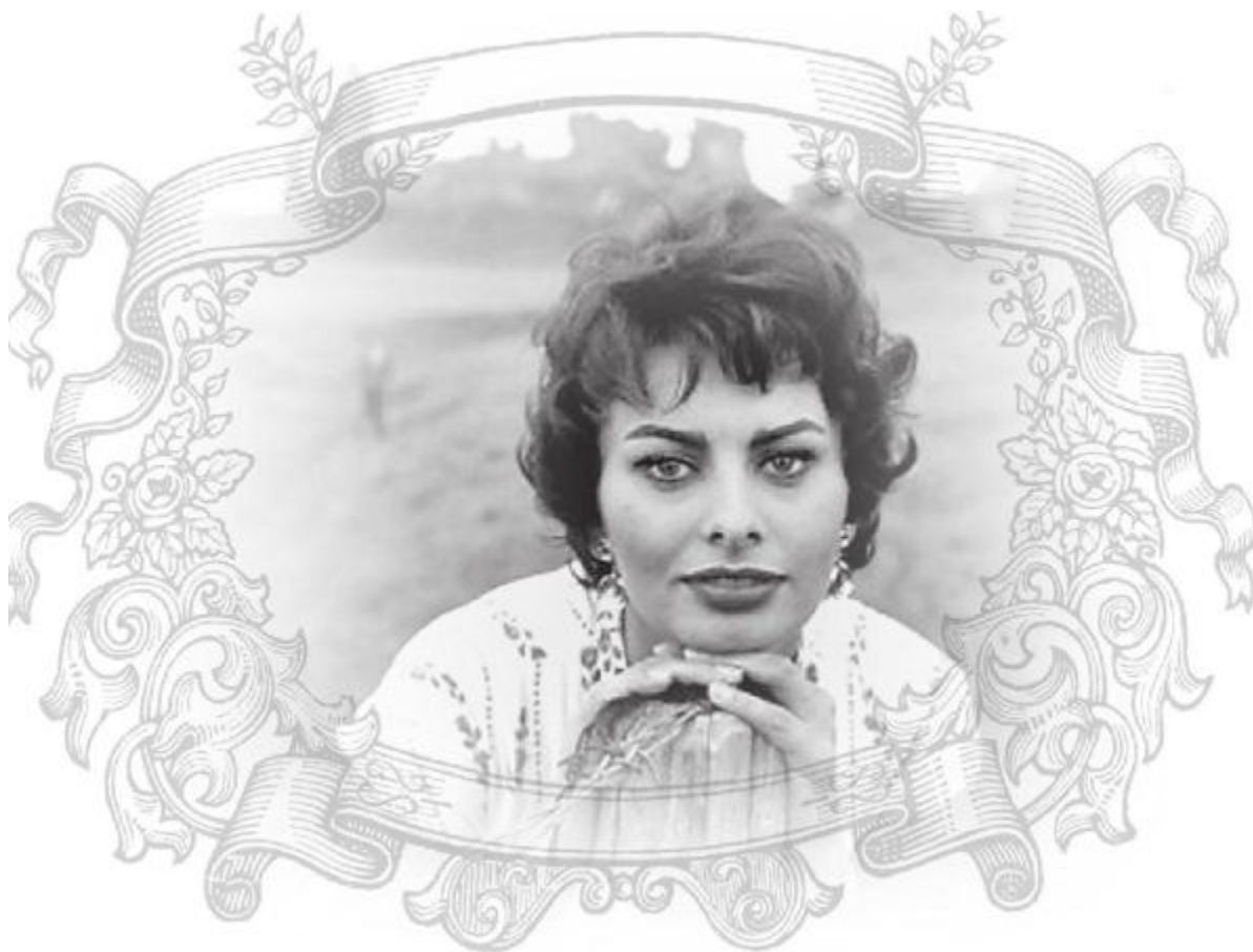
Фотопортрет Софи. 1957 год.

Правда, помимо Понти был в жизни Софи человек, который мог распоряжаться её судьбой по своему усмотрению. Ему Лорен возражать не смела. И это... Витторио Де Сика.