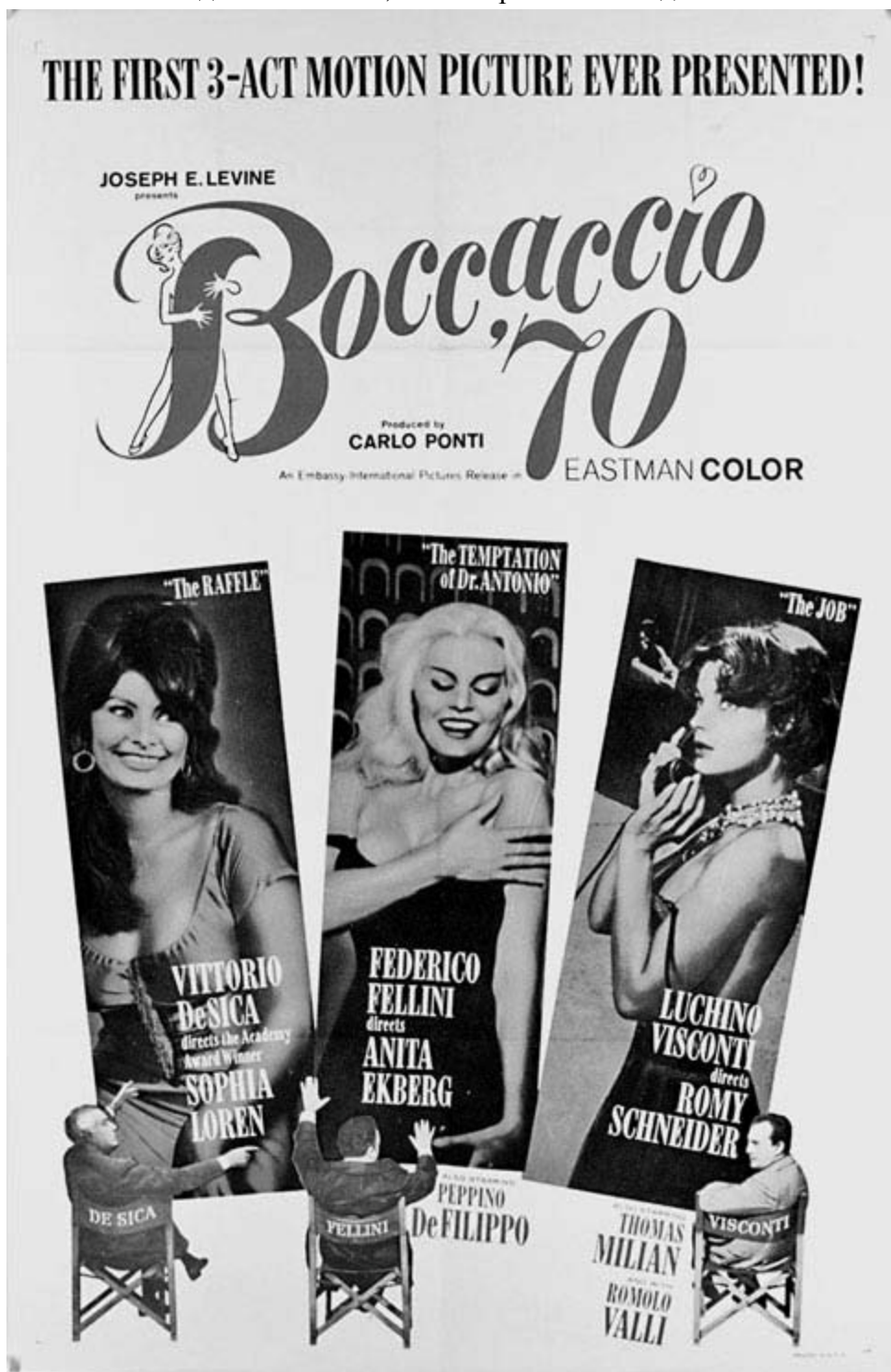
Афиша к фильму

«Боккаччо 70» можно использовать в качестве учебного пособия и режиссёрам, и актёрам. Первым картина расскажет, как следует ставить кино, вторым – как играть. Поможет ли на деле? Конечно, нет. Но разве в этом дело?