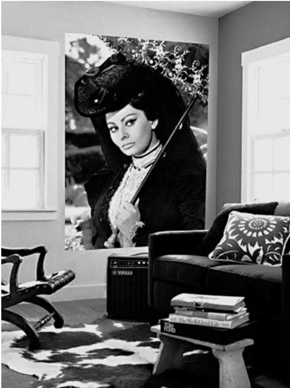
Дома у Софи Лорен