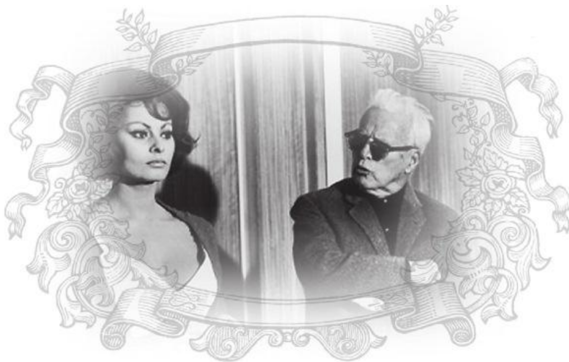
Софи Лорен и Чарли Чаплин на съёмочной площадке.

Она была не просто послушной, она была покорной. И это Софи Лорен, которая привыкла мотаться по миру из студии в студию, которая никогда не сидела без дела и была сильной самостоятельной женщиной. Но перечить Карло она не могла. Дала слово и – держала его. Она так мечтала о собственном ребёнке... И – дождалась.