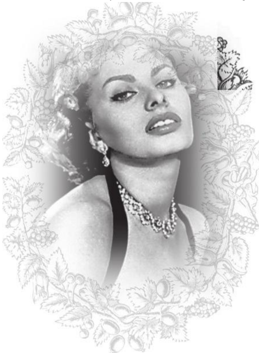
Софи Лорен в 1957

что было в его власти? Что угодно, только не собственное сердце.