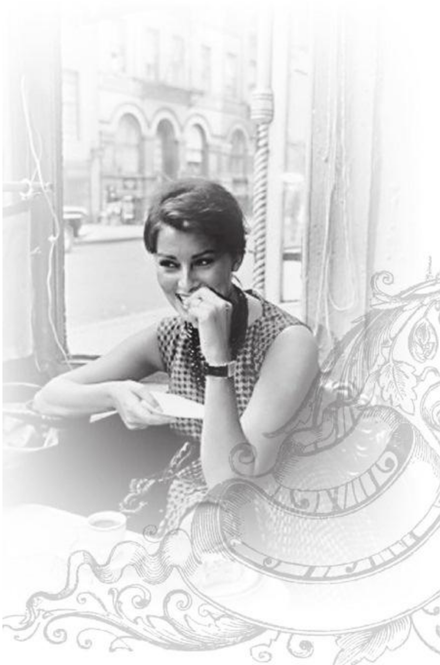
Фотография из другого времени, Софи в римском ресторанчике.

Её красота была какой-то острой, останавливающей взгляд, сражающей наповал. И в то же время – очень спокойной, лишённой даже намёка на некую порочность... Это была настоящая итальянка – какой её обычно представляют. Собственно, эти представления и сформировались под влиянием Софи Лорен. Она настолько прочно и так давно заняла свой пьедестал, что всем кажется, будто её образ – как канон женской красоты – существовал всегда, задолго до явления Софи. Но это не так. Взгляните на портрет Мери Пикфорд, на созданный ею образ женщины-ребёнка. В 1920-е годы именно Пикфорд считалась красивейшей женщиной планеты. Но это совершенно иная красота, чем у Софи.