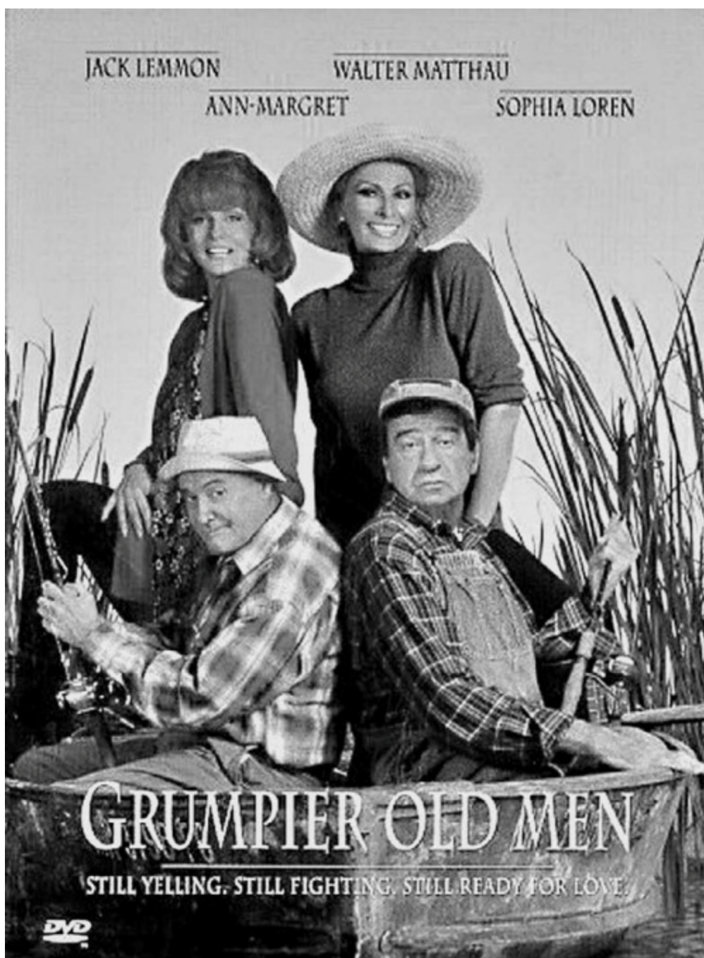
Постер к фильму «Старые ворчуны разбушевались». 1995 год.