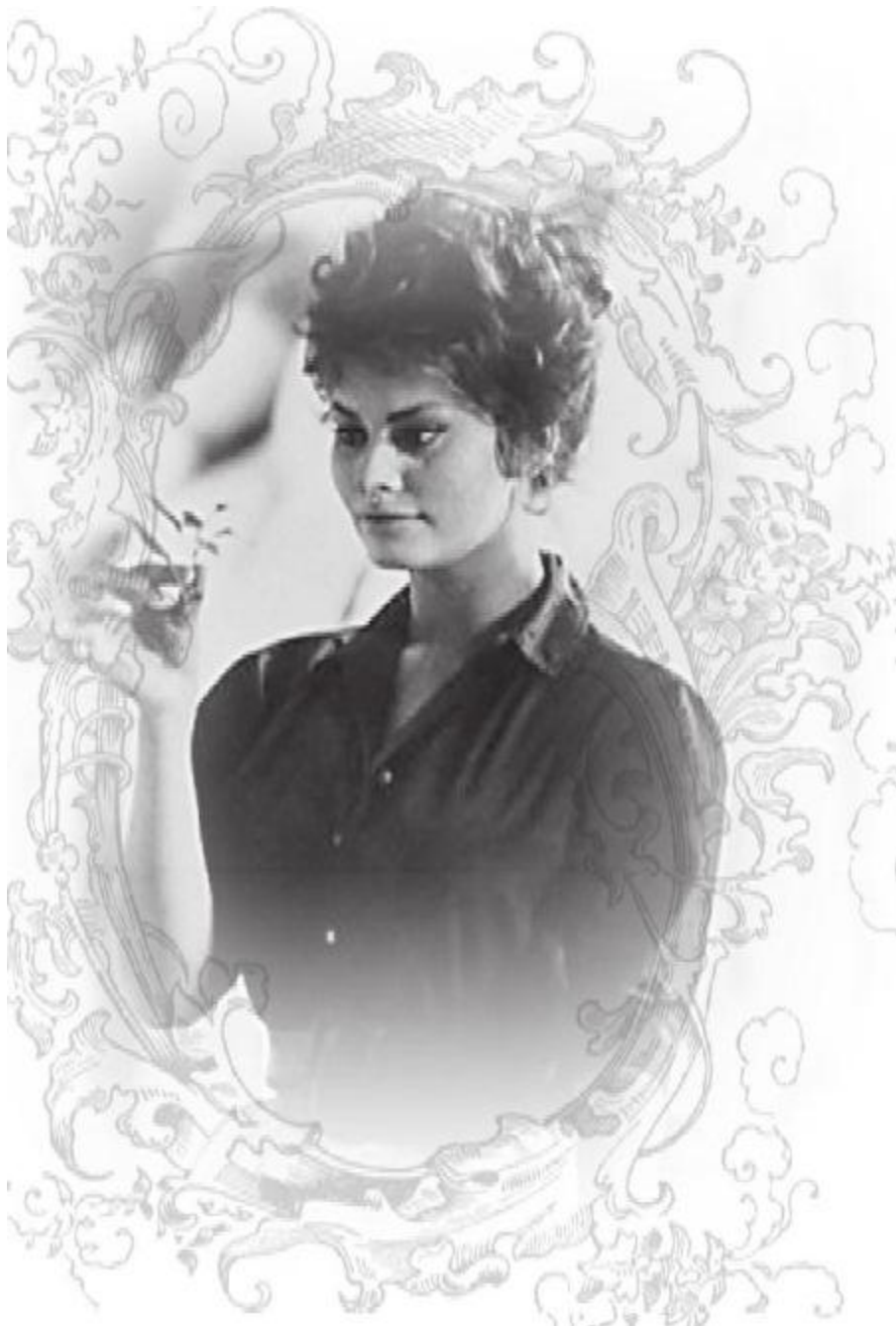
Софи Лорен. 1961 год.