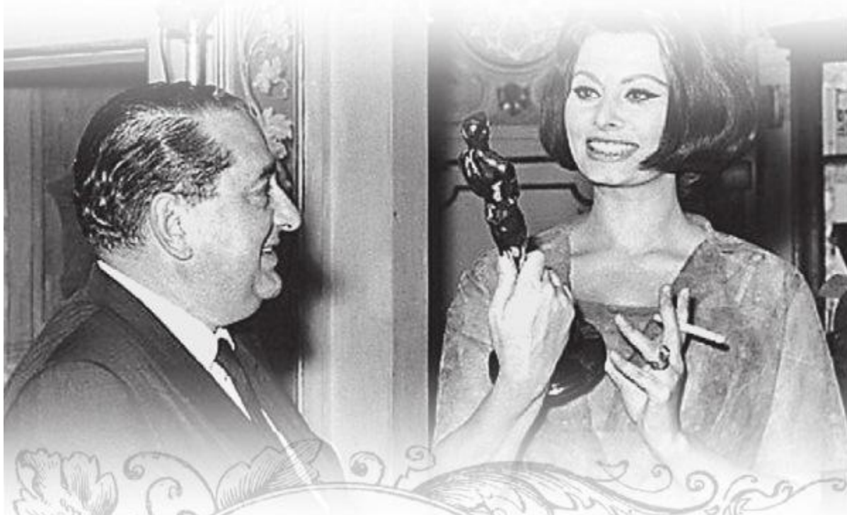
Первый «Оскар» Софи.

А Витторио Де Сика был доволен. Софи сыграла именно то, что он задумал. И фильм «Чочара» стал вершиной неореализма, лучшей картиной Мастера и... лучшим фильмом в карьере Софи. Хотя впереди у 26-летней женщины было ещё много выдающихся ролей.